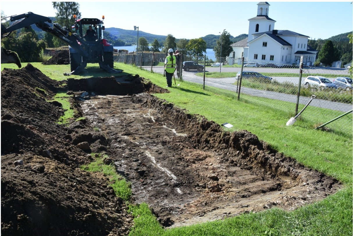
Figur 5. Schakt 4 med berghäll närmast i bild. Vid grävmaskinen har det fyllts ut för att behålla samma nivå över hela ytan. Foto från norr.