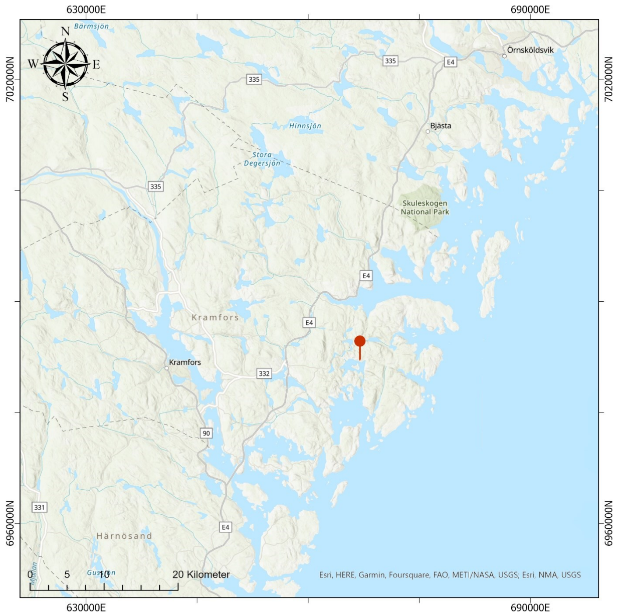
Figur 1. Översikt över utredningsområdet.