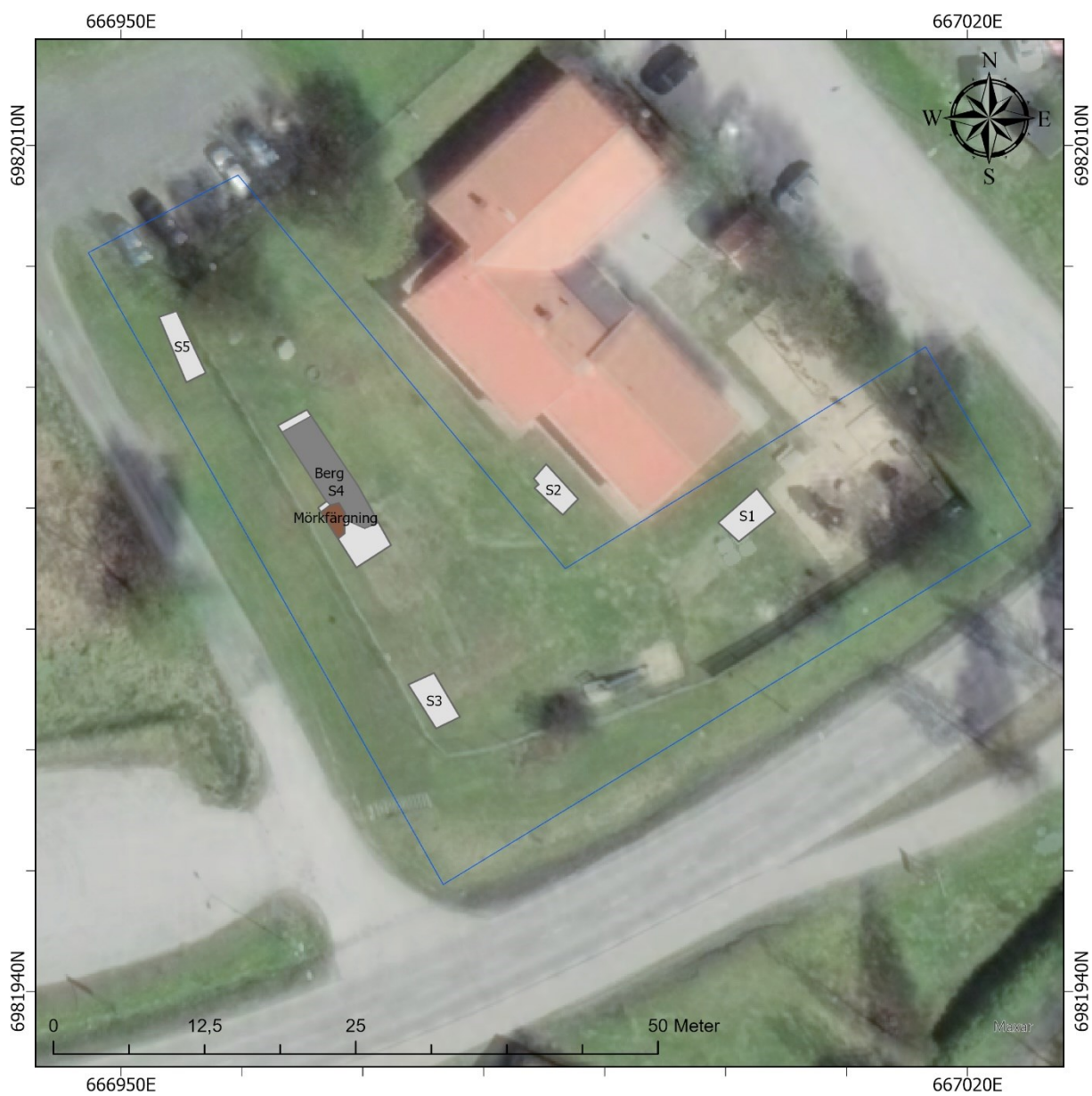
Figur 3. Schaktplan.