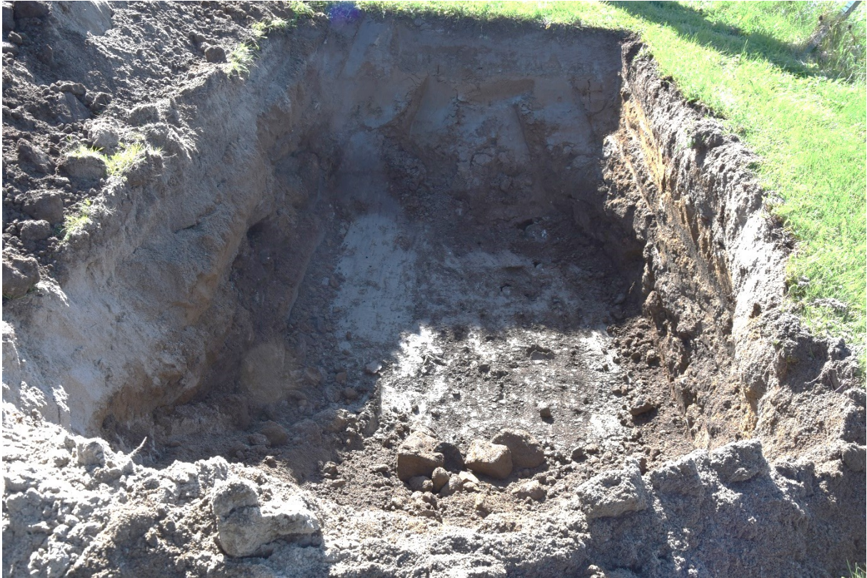
Figur 4. Schakt 3. Grå lera i botten under fyllnadsmassorna. Foto från nordväst.