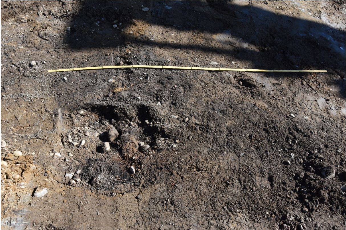
Figur 6. Recent mörkfärgning med sot, sten och grus i schakt 4. Foto från väster.