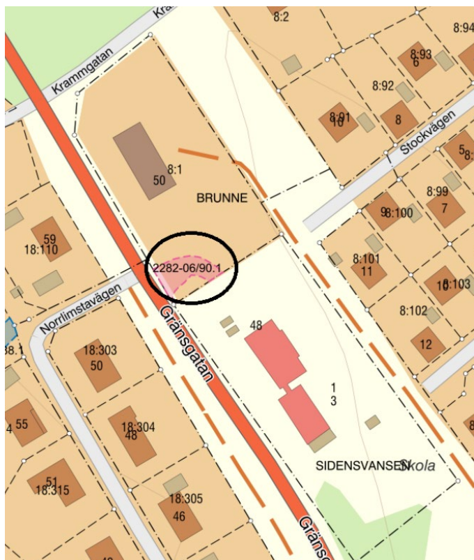
Bild 1. Befintligt in- och utfartsservitut enligt rund ring

I planhandlingarna står det att det officiella servitut (2282-06/90.1) som fastigheten Sidensvansen 1 idag använder som in- och utfartstrafik över Brunne 8:1, se bild 1 nedan, ska vara kvar. Om in- och rätten är så pass viktig ((väsentlig betydelse)