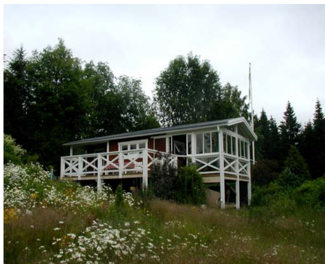
Fönster med stående format Träpanel målad med Falu Rödfärg