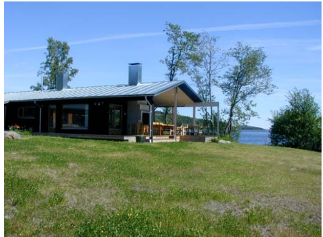
Ny byggnad med långsmal volym