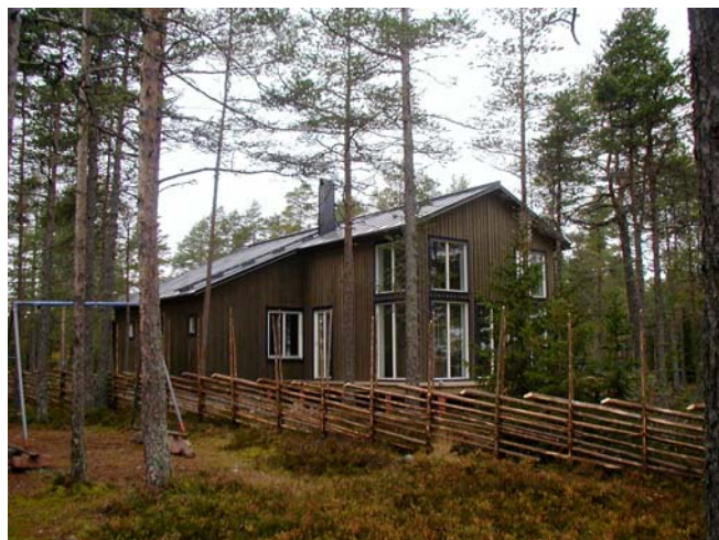
Falsad plåt på taket och järnvitriolbehandlad träpanel.

Falsad plåt är en bra och traditionell takbeläggning på huvudbyggnader, liksom trapetskorrugerad plåt och pannplåt på förråd och sjöbodar.