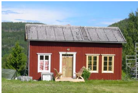
Äldre hus med spröjsade fönster i stående format

Använd stående format för fönstren, se till att rutorna utgör stående rektanglar eller åtminstone är kvadratiska.