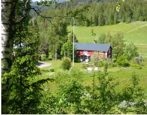
Äldre långsmal byggnad

Välj en långsmal byggnad med symmetriskt tak och med nocken på mitten. Då följer du landskapets tradition.