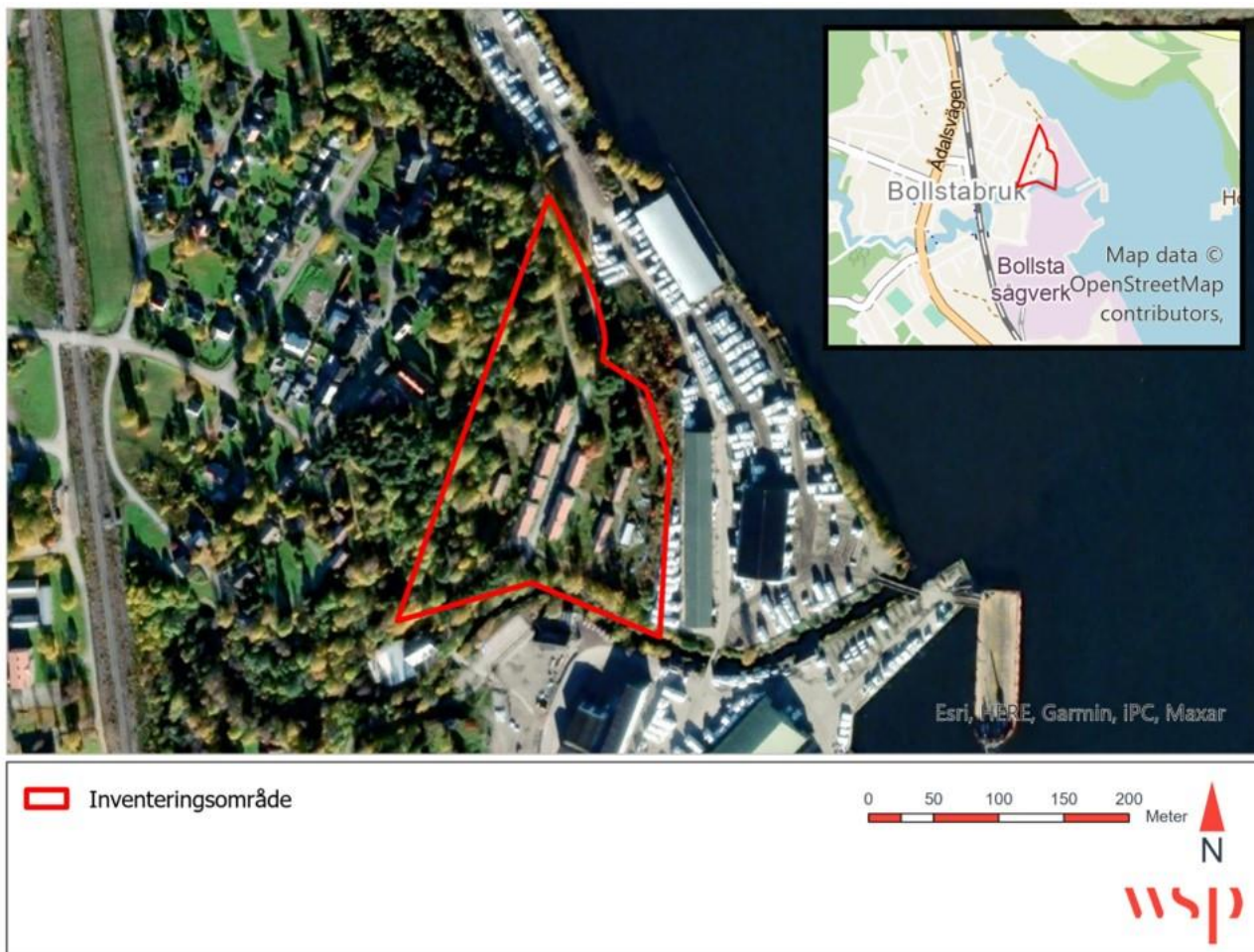
Figur 2. Översiktskarta över inventeringsområdet.