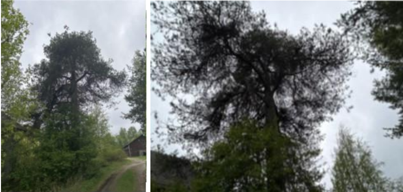
Bilaga 4 visar bilder på träd, T4.