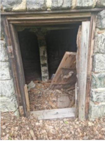
Bilaga 8 visar bild på potentiell ingång för fladdermöss till en gammal jordkällare.