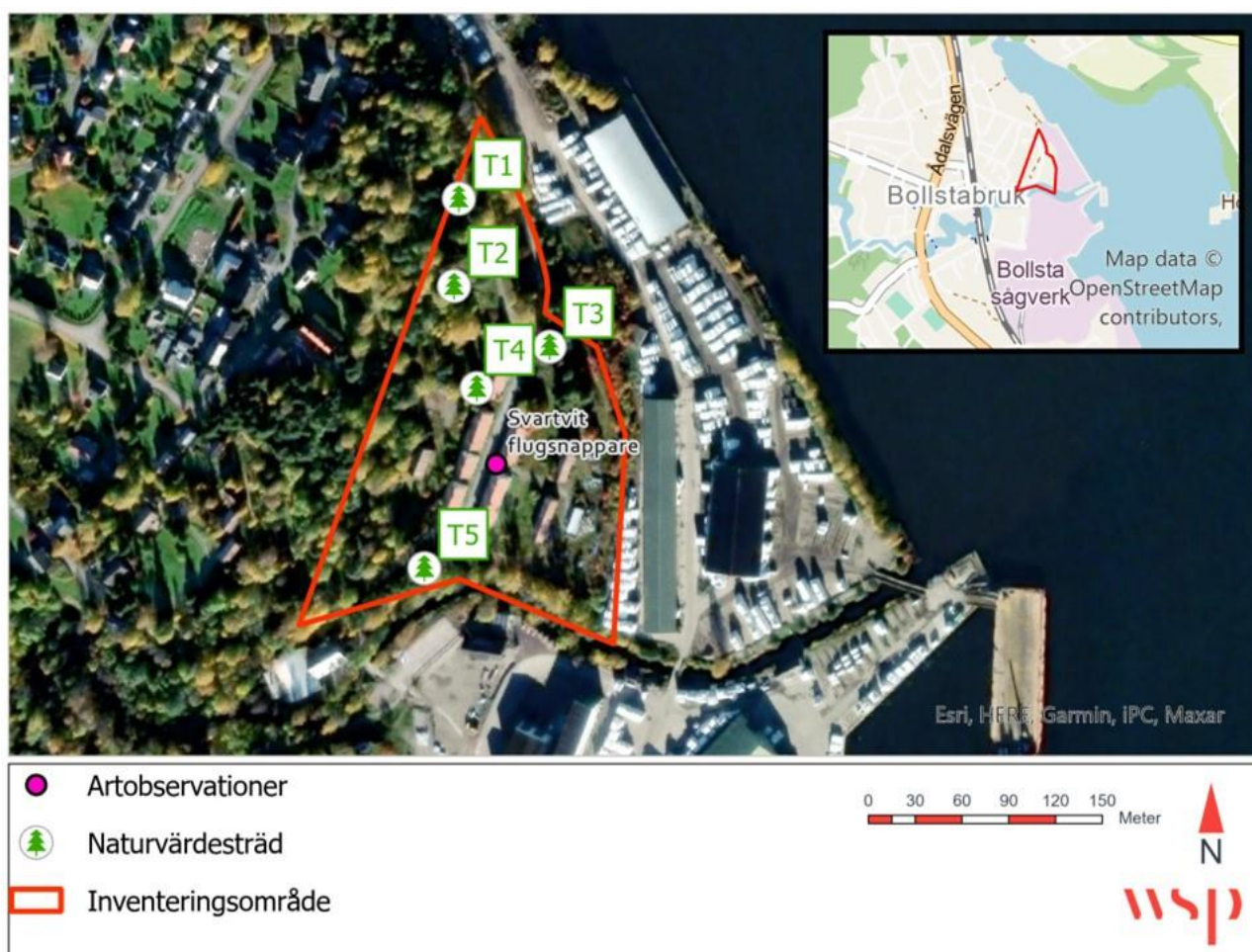
Figur 6. Karta över artfynd samt fynd av naturvärdesträd under inventering.