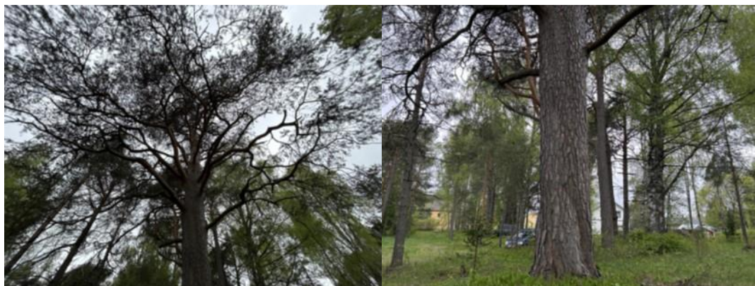
Bilaga 1 visar bilder på träd, T1.