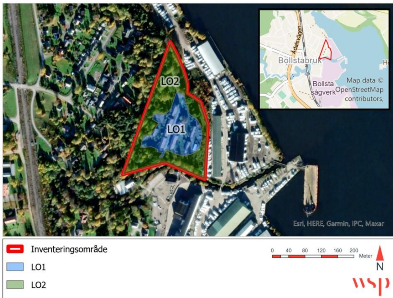
Figur 5. Landskapsområden med ID-nummer inom inventeringsområdet.

Området utgörs till merparten av skogsmark och sträcker sig längs hela inventeringsområdets yttersta gränser.