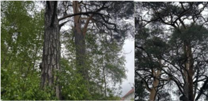
Bilaga 5 visar bilder på träd, T5.