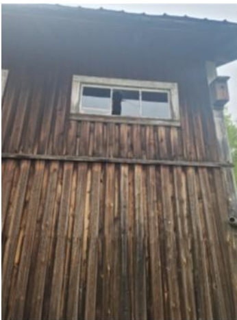
Bilaga 7 visar bild på potentiell ingång för fladdermöss till en gammal lada.