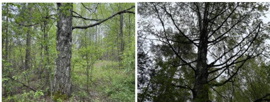
Bilaga 2 visar bilder på träd, T2.