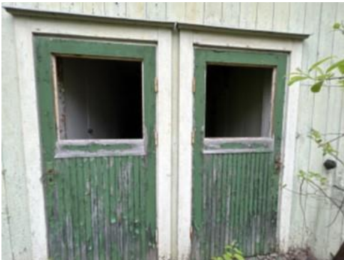
Bilaga 6 visar bild på potentiell ingång för fladdermöss genom saknad av dörrarnas fönster.