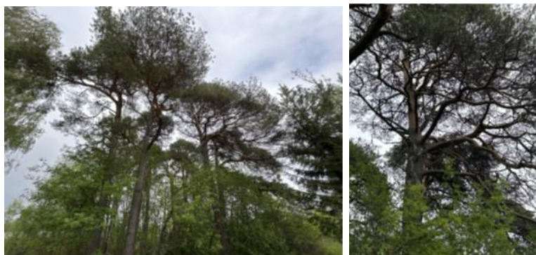
Bilaga 3 visar bilder på träd, T3.