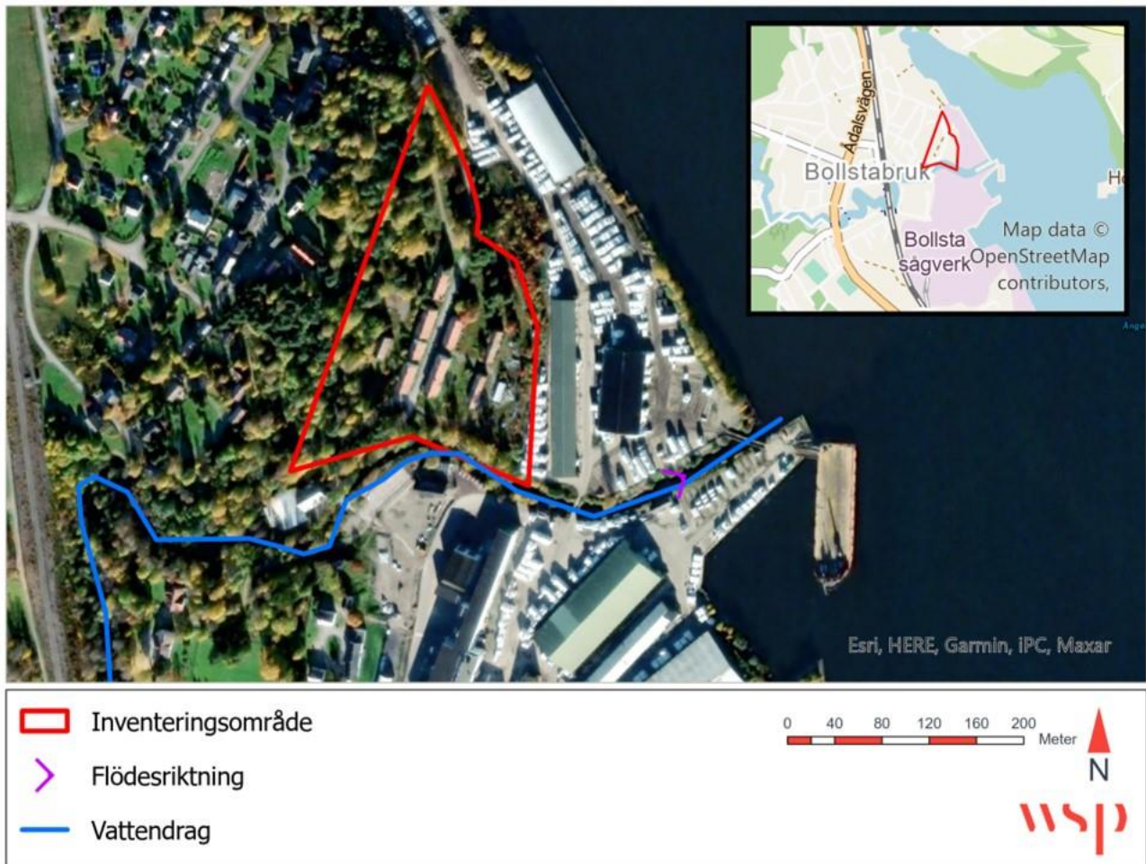
Figur 4. Vattensystemen inom och omkring inventeringsområdet. Bollstaån kan ses rinna från sydväst till nordöst genom inventeringsområdet och mynnar ut i Ångermanälven.