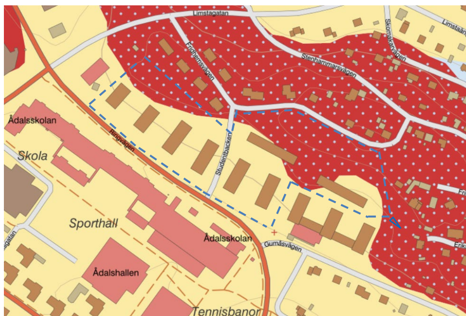
Karta 5: Utdrag från SGU:s jordartskarta med skala 1:2500. Gult: Lera-silt. Rött med blå prickar: Berg/Morän. Ändringsområdet markeras ungefärligt med blått.

Jorddjupskartan från Sveriges geologiska undersökning (SGU) skattar jorddjupet till 5-10 meter för ändringsområdet. Jordarterna i området bedöms vara lera-silt och berg/morän.