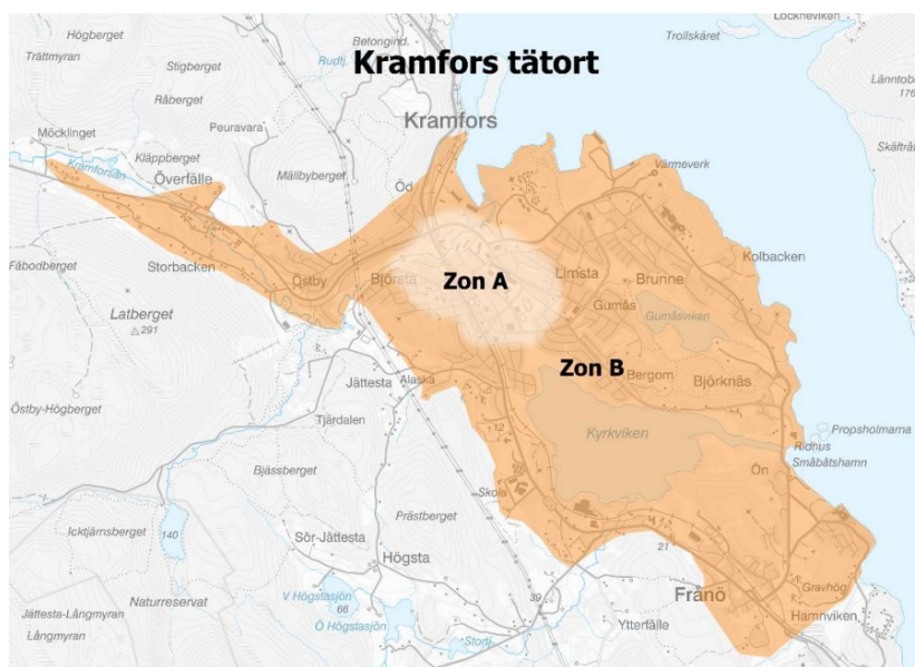
Karta 4: Karta över A och B zon i Kramfors tätort.

I tabellen nedan redovisas normen för parkeringar vid ny- och ombyggnation av flerbostadshus.