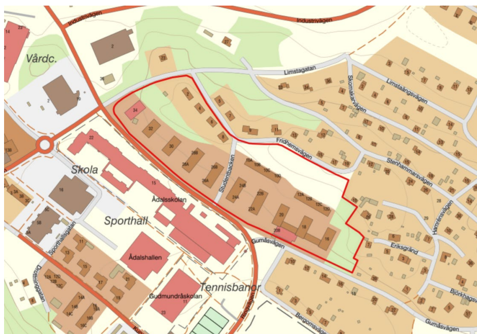
Karta 3: Samrådskretsen markeras ungefärligt med rött.

Detaljplanens samrådsrets består av närliggande fastighetsägare samt andra aktörer som bedöms beröras av ett genomförande av detaljplanen. I kartan nedan redovisas detaljplanens samrådsrets.