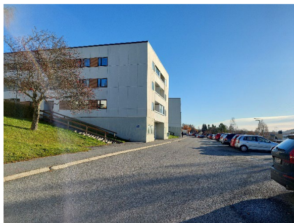
TV: Bild tagen från vägen Studentbacken, i riktning ner mot hus på Magistern 6.