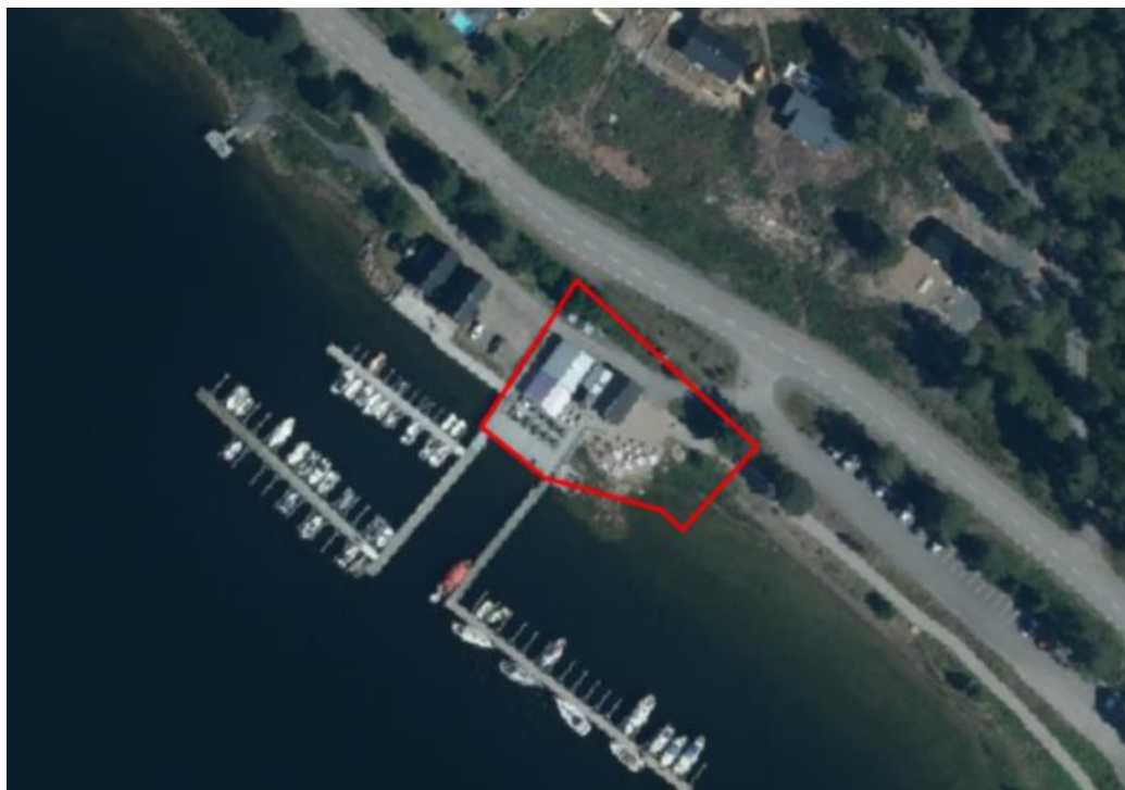
Ortofoto över ändringsområdet. Området markeras ungefärligt med rött